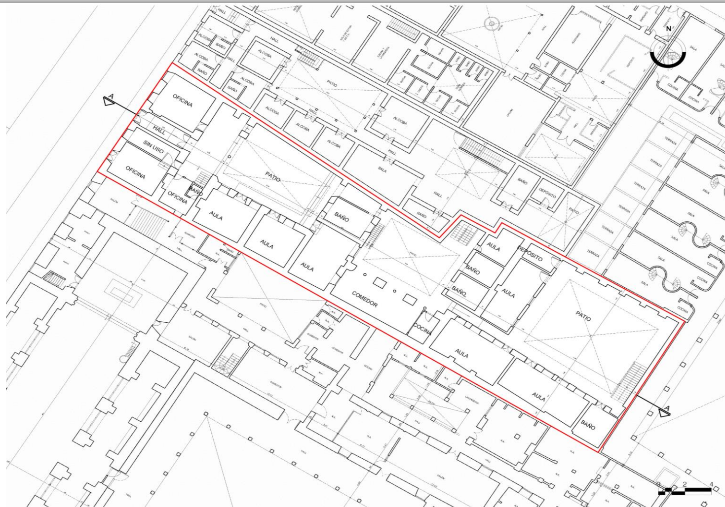
Planta primer piso